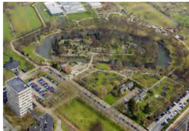
... en erna

omdat het vaak om laaggelegen landbouwgronden ging. Er was geen wettelijke beperking voor onroerend goed in die gebieden, omdat deze militair van minder belang waren. Om die reden vinden we dan ook dat er in deze gebieden een 'ja, mits' moet gelden als het om nieuwe bebouwing gaat. Die bebouwing moet dan wel in het open landschap passen.'