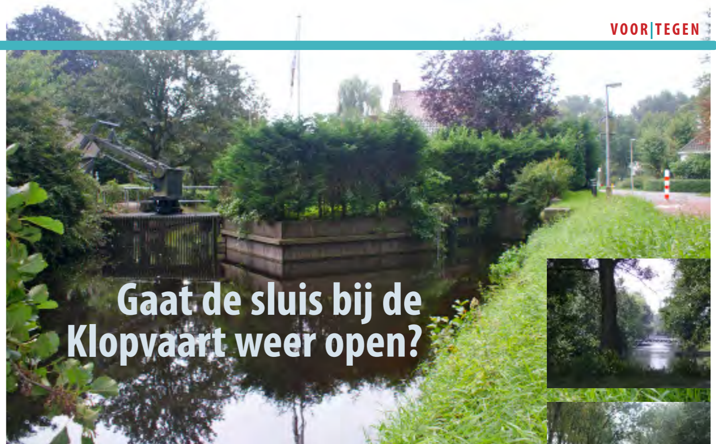
Zicht op de sluis en op de achtergrond de sluiswachterswoning. Rechts: de Klopvaart

'Dat zal de nodige tijd en energie gaan kosten, maar dat is het naar mijn idee meer dan waard. De openheid rond de forten die we met z'n allen zo lang hebben weten te waarborgen, moet behouden blijven. Een herhaling van projecten als de Utrechtse universiteitswijk De Uithof en de nieuwbouwwijk Lunetten, die na de afschaffing van de Kringenwet wel erg dicht bij de forten zijn neergezet, willen we voorkomen. En daar zetten we ons dus voor in.' ●