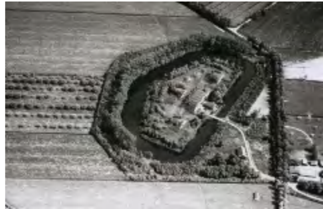
Fort Hoofddijk voor de bouw van de Utrechtse Uithof...

Zicht op Verboden Kringen: 300, 600 en 1000 meter