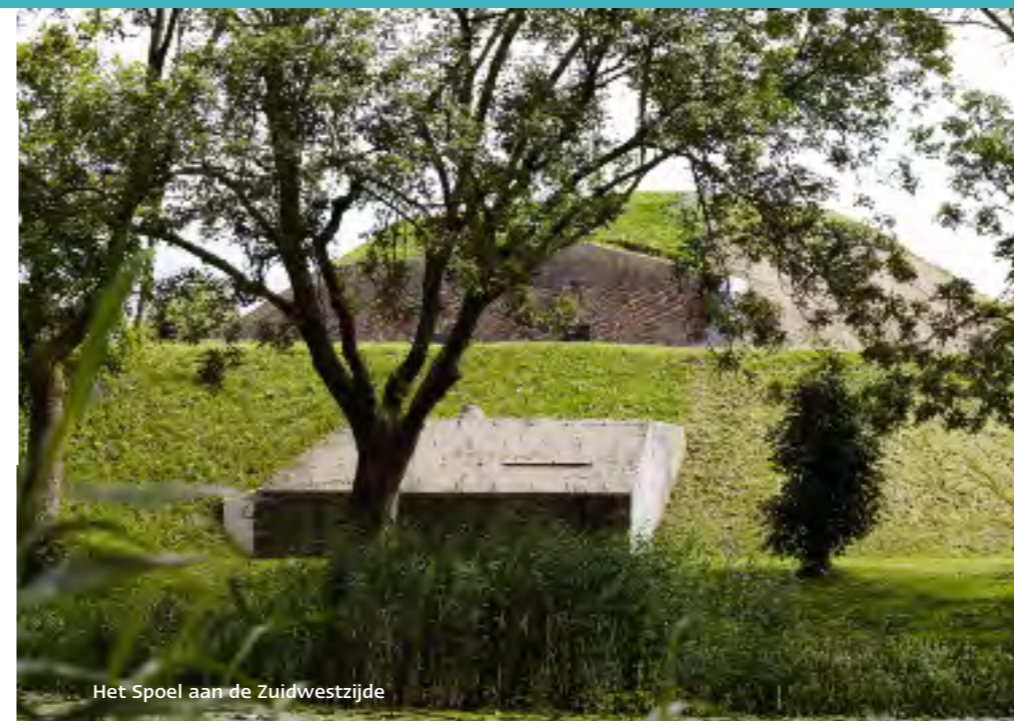
Het Spoel aan de Zuidwestzijde